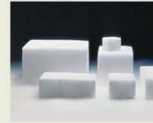
ドライアイス(1日分)