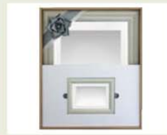
写真(四つ切・小額付)